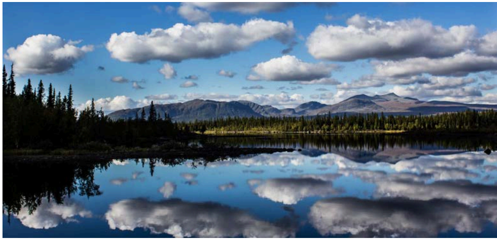
Kultsjön med Marsfjällen i bakgrunden